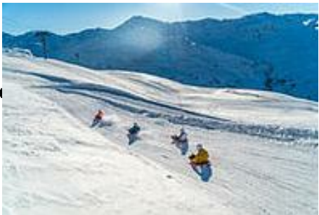
Piste de luge Roc'n Bob