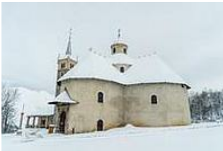
Sanctuaire ND-de-la-Vie (St-Martin-de-Belleville)