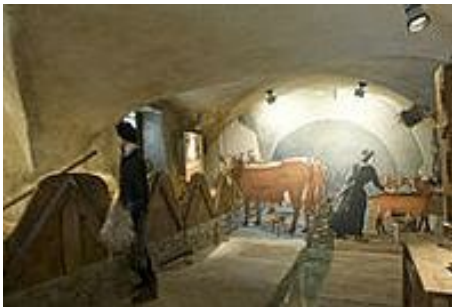
Musée de Saint Martin, 150 ans d'histoire d'une haute-vallée de Savoie